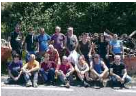
laz Luzarrako (Araotz) zabortegia garbitzen aritu zen taldea