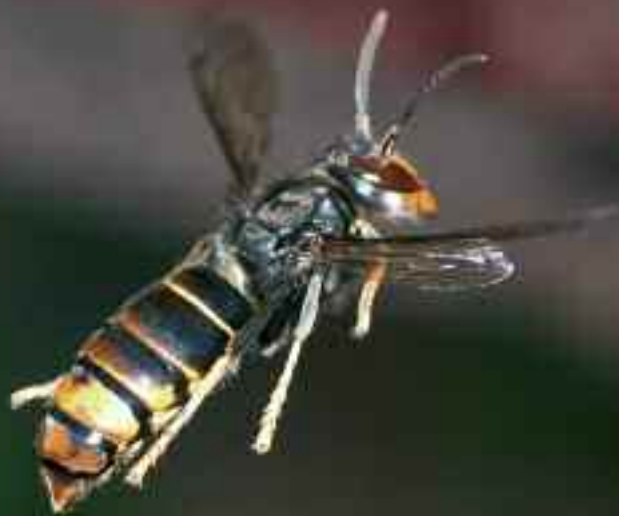
Asiako liztor bat bertako erlea erasotzeko prest

Dagoeneko 50 habia kendu dituzte Oñatin; iazkoak halako bi garai honetan