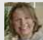
Arantazu Ibarrondo udal liburutegiko zuzendaria

Urriaren 24an LIBURUTEGIEN NAZIOARTEKO EGUNA ospatuko da mundu zabalean eta azken bi urtetan bezala, Oñatiko Udal liburutegiak hainbat jarduera antolatzeaz gain, liburutegiak gaur egungo gizartean duen papera azpimarratzea nahiko genuke.