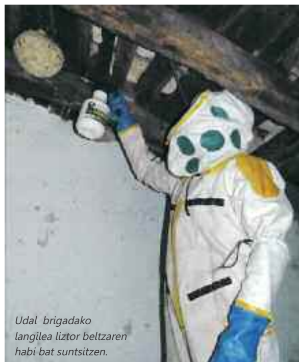
Udal brigadako langilea liztor beltzaren habi bat suntsitzen.

Bestela, astean behin programatzen dituzte habiak kentzeko lanak. Bi pertsona aritzen dira zeregin horretan: udal brigadako burua (biozidak aplika-