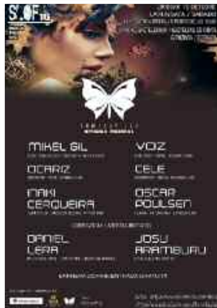
Cerqueiraren SomedayLab zigiluarekin lan egiten duten zazpi artista ariko dira DJ lanetan ( www.facebook.com/somedaylab )

SomedayLab izeneko diskoetxe bat sortu dut, eta herrian egin nahi dut lehenengo aurkezpena. Nire zigiluarekin lan egiten duten zazpi DJ ariko gara 8 orduz Gaztelekuan, arratsaldeko 4retan hasita. Jaialdi polita izango da. Oñatin ez dago musika elektronikoa entzuteko ohitura handirik, eta aukera ona