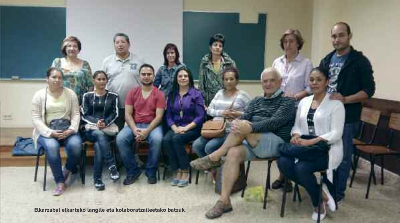
Elkarzabal elkarteko langile eta kolaboratzaileetako batzuk