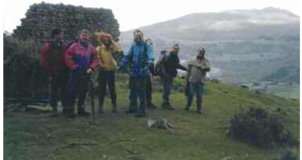
Kapirixo taldeko kide batzuk San Juan Artian.

Aspalditxotik neukan susmoa toki hori antzinako bizilekua izan zitekeela. Oñati, Erdia Arozaz geroztik, Ipar Arabako jauntxo gebaratarren uztarriak lotzen zuen. Hori dela eta, San Juan Artia eta Katilluiturrin makina bat mandazain eta bidazti ibiliko zen aurrera eta atzera, gizaldi askotan. Orduan alda-