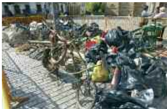
Urtero bezala, herriko plazan jarriko dituzte ikusgai errekatik ateratako hondakinak

Luzarrako zabortegiaren garbiketa . Goizeko 10etan herriko plazan. Ondoren bazkaria Araotzeko auzo-etxean