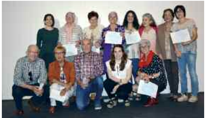
Bizpoz-en lehen edizioan 14 oñatiarrek parte hartu zuten, eta oso aberasgarria izan zela adierazi dute.

► Urriaren 18an egingo da programaren aurkezpena kultur etxean, 18:00etan.